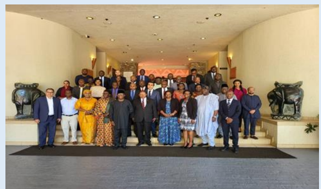
Photo de famille lors de la retraite du CSP à Victoria Falls au Zimbabwe