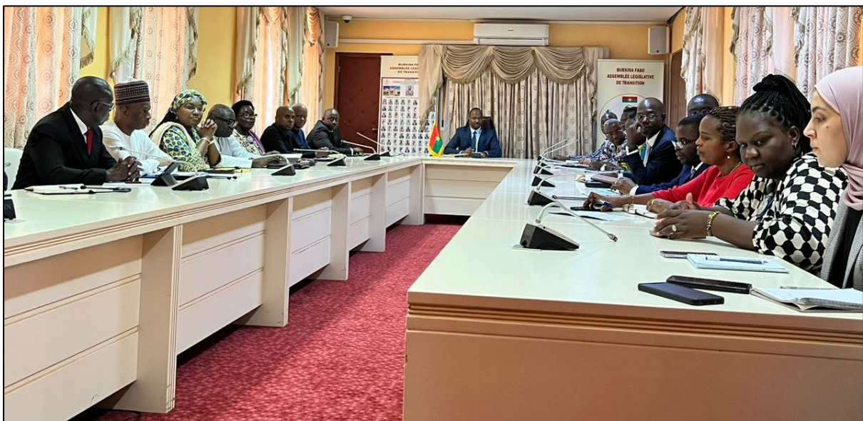
Échanges avec le président de l'Assemblée nationale

15. Contrairement aux allégations des représentants des partis politiques, le Président de l'Assemblée législative de transition a déclaré que l'Assemblée compte 12 députés représentant les partis politiques. Cependant, il a déclaré que les échanges effectifs avec les partis politiques étaient quelque peu difficiles en raison de la suspension de leurs activités, ajoutant que les représentants des partis politiques refusent généralement les invitations à des concertations, en invoquant la suspension, alors qu'ils sont disponibles pour des rencontres avec d'autres parties prenantes. Il a ajouté que si le peuple du Burkina Faso n'aimait pas les autorités actuelles de la transition, celles-ci auraient été renversées depuis longtemps. Il a rassuré la délégation du CPS que toutes les mesures prises dans le cadre des réformes clés l'ont été de manière collective et ce, en vue de permettre au pays de relever efficacement ses défis et d'éviter une nouvelle crise.