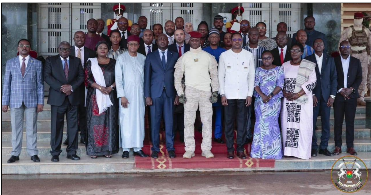
Le CPS de l'UA a rendu une visite de courtoisie au Président de la Transition, le Capitaine Traoré.

11. En outre, Le Président a expliqué que la Charte de transition comportait un calendrier qui fixait la date limite du 24 juillet 2024 convenue collectivement avec la CEDEAO comme date limite pour les élections et, d'après le rapport, le calendrier reste valable. Il a toutefois souligné qu'il était nécessaire d'examiner les questions fondamentales dans le pays, en particulier le contexte sécuritaire, à la lumière de la feuille de route de la transition. Il a souligné que si les principaux défis et menaces auxquels le pays est confronté étaient relevés avant l'échéance convenue, le gouvernement de transition convoquerait des élections avant 2024. Pour ce qui est de du programme de transition, le Président a informé la délégation que l'Autorité de transition avait déjà engagé des consultations avec les principales parties prenantes dans tout le pays, y compris les chefs traditionnels et les dirigeants des organisations confessionnelles, ainsi que les organisations de la société civile, afin de solliciter leurs points de vue sur les réformes clés telles que la constitution, le code électoral, la charte de transition, ajoutant que le rapport est en cours de finalisation et que les conclusions seront partagées.